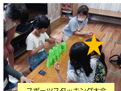
スポーツスタッキング大会