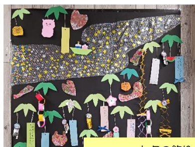
七夕の飾りつけをしよう♪

夏休みに入ってから10時までは学習の時間とし、毎日イベントを行うことで、メリハリのある日々を過ごしています。暑い日が続きますが、水分補給をしっかりと、今月も楽しんでいきたいと思います(^^♪