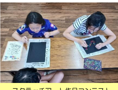
スクラッチアート作品コンテスト