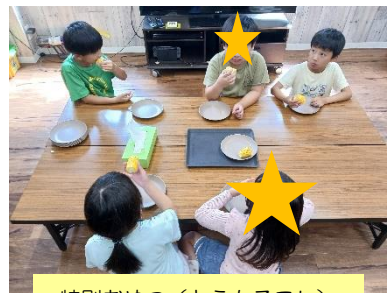
特別おやつ（とうもろこし）